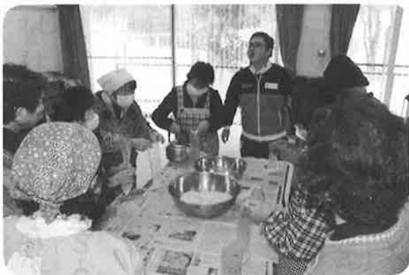
炊き出し訓練の様子

県支部の講師のお話を聞き、改めて適度な運動、バランスの摂れた食事、新しいことに興味・関心を持ち 外出の機会を持つことが重要であることを学びました。同日に、各地域からの奉仕団員を対象とした、包装食袋(ハイゼックス)を使った炊き出し訓練も行いました。