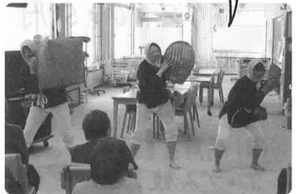
職員の出し物も盛り上がりました!