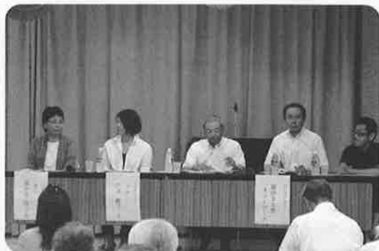
活動の事例をお話するシンポジウムの皆さん自然しました!