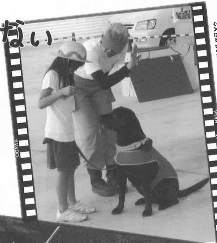
災害救助犬 救助デモンストラーション