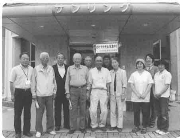
配食ボランティアのお問い合わせは 小川村ボランティアセンターまで

当日は、7名のボランティアさん、社協会長調理手等が出席。日頃利用者の方にお届けしているお弁当を試食し、日々活動で感じていることや、お弁当を試食しての感想を述べるなど和やかな昼食会となりました。