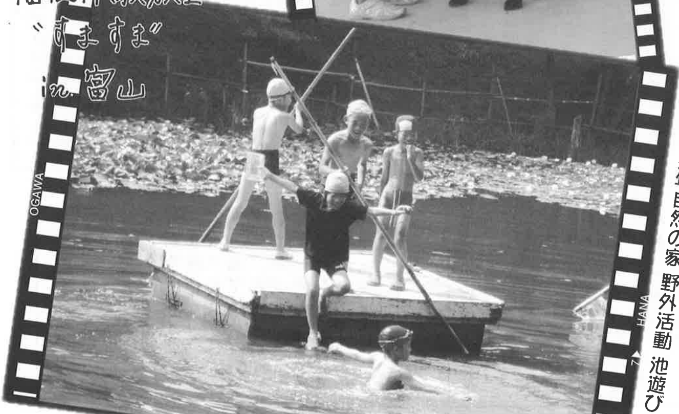
長羽青少年自然の家 野外活動 池遊び